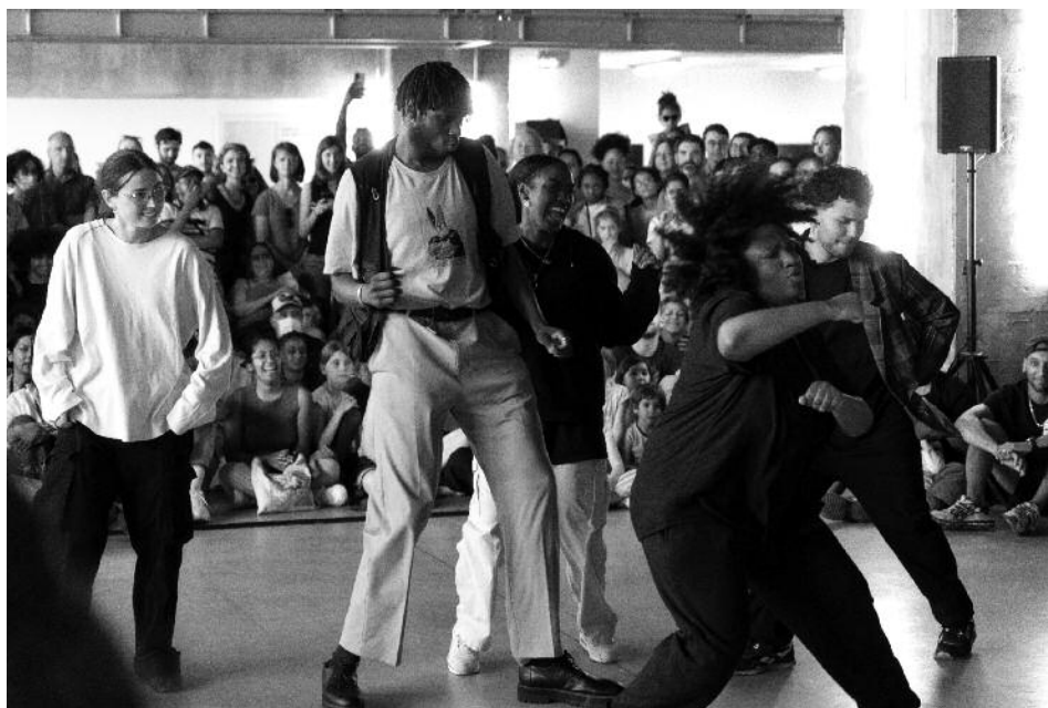
1 km de danse 2022, battle