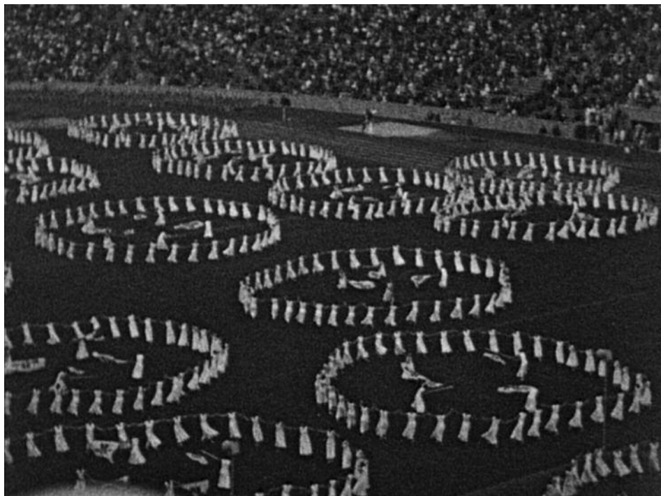
Les Jeux d'Hitler, Berlin 1936, Jérôme Prieur (2016) © Roche Productions