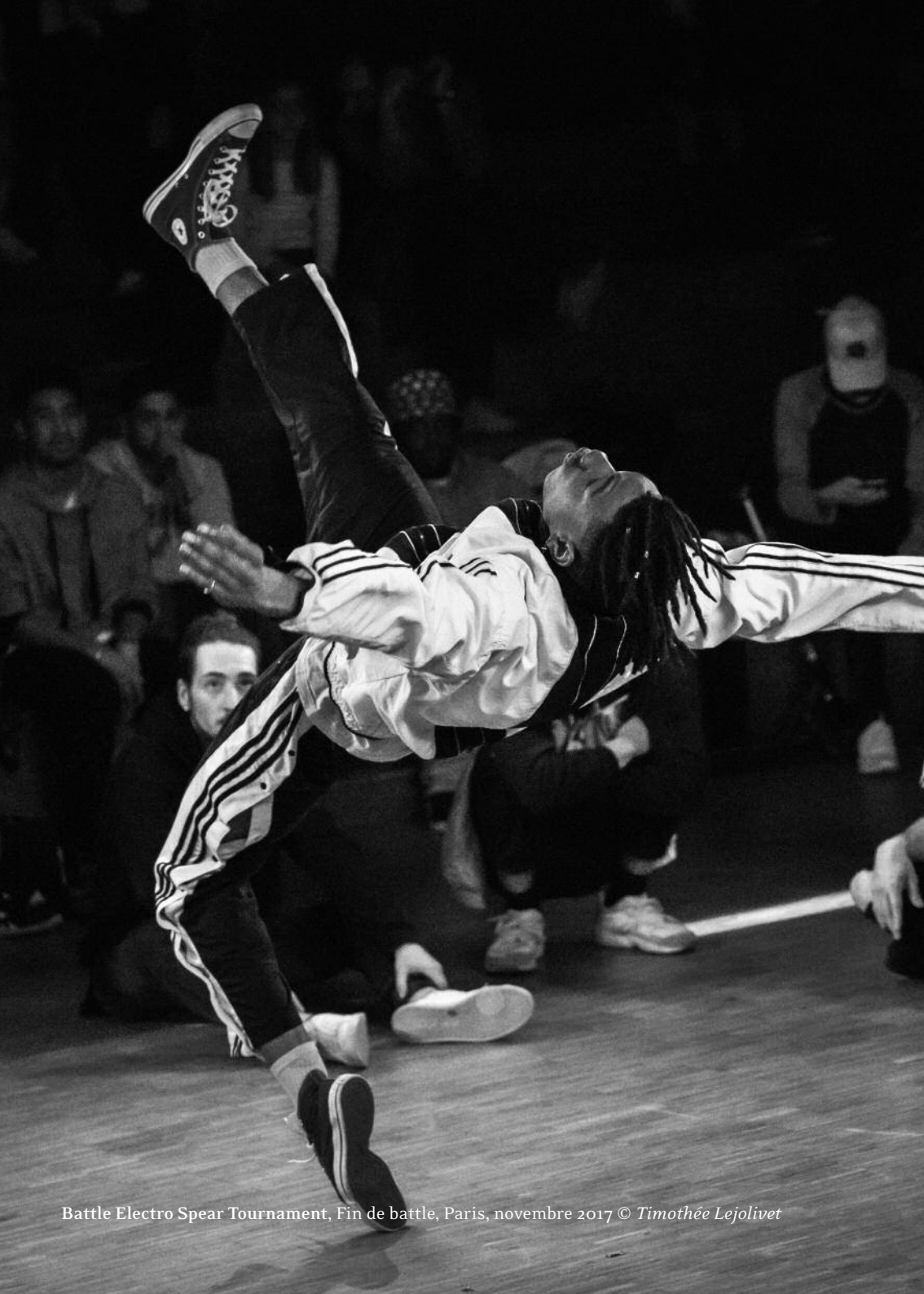
Battle Electro Spear Tournament, Fin de battle, Paris, novembre 2017