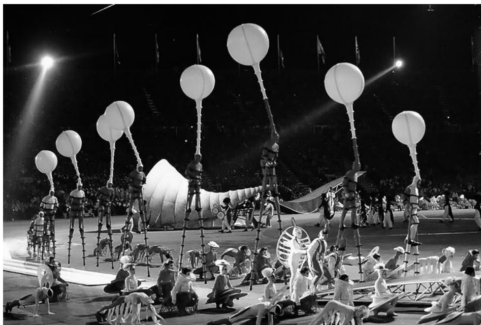
Jeux olympiques d'Albertville, France. Vue générale de la cérémonie d'ouverture, direction artistique Philippe Decouflé, 8 février 1992