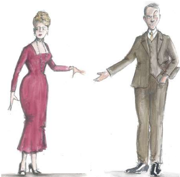
Croquis de Laurent Pelly pour les costumes de Caroline et Duparquet

L'action se déroule dans la petite ville de Pincornet-les-Bœufs, un soir de réveillon.