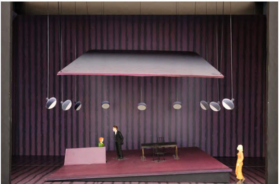
Images du projet scénographique