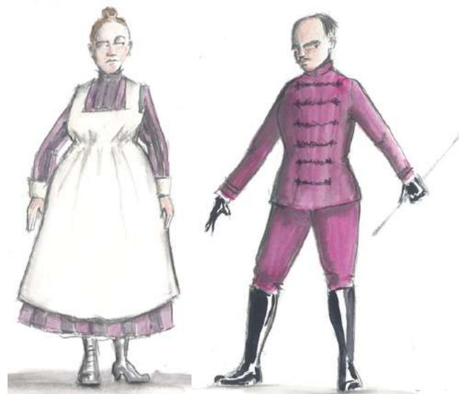
Croquis de Laurent Pelly pour les costumes d'Adèle et Orlofsky