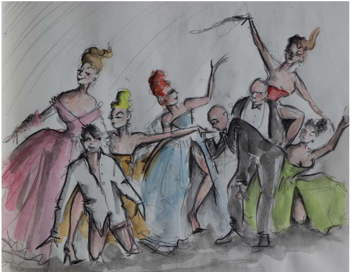
Croquis de Laurent Pelly pour La Chauve-Souris