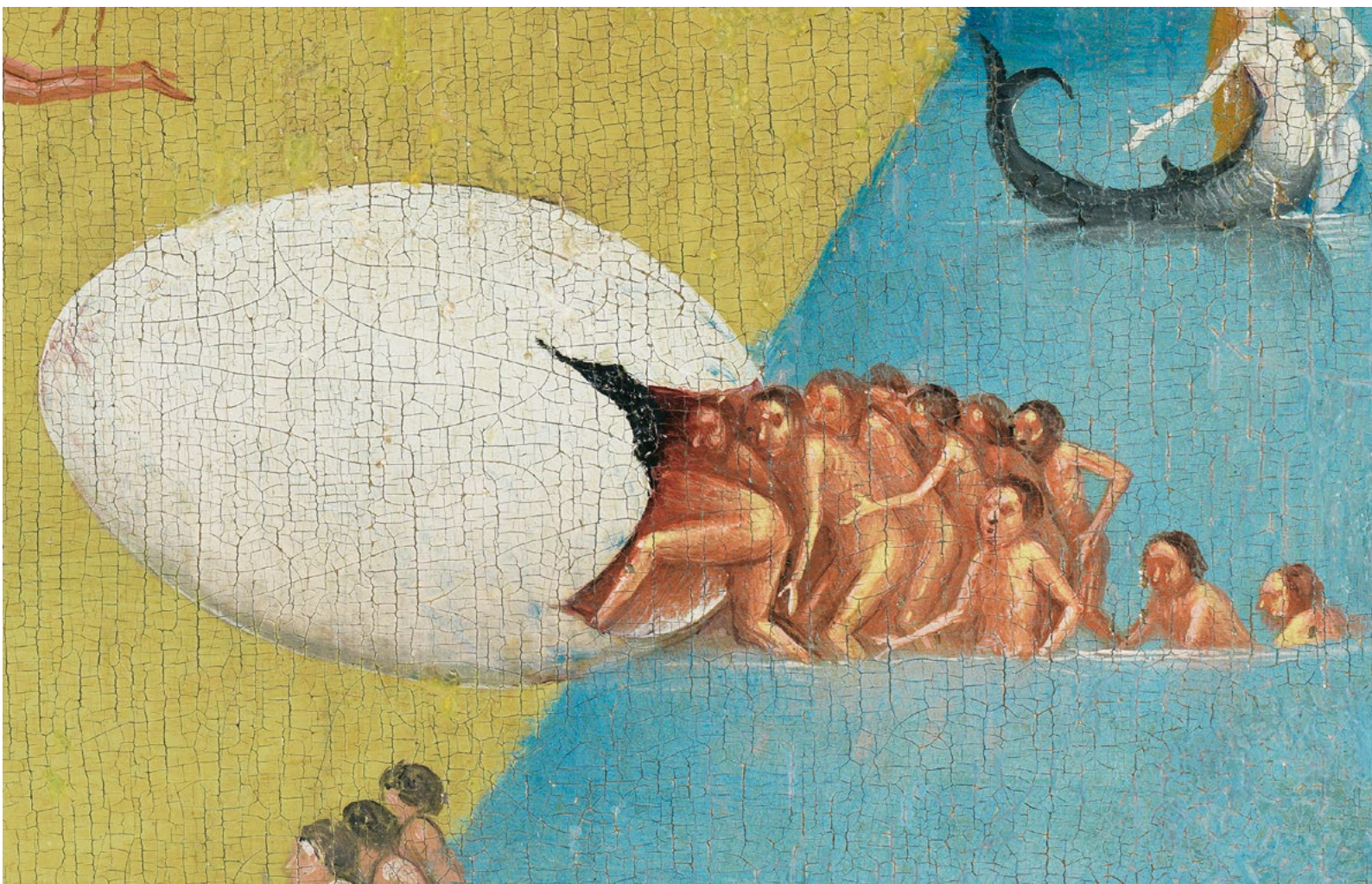
Jérôme Bosch, Le Jardin des délices, 1490-1500, huile sur bois, 185.8 cm x 172.5 + 76.5 cm, N° d'inventaire P002823. Détail. Madrid, Musée national du Prado