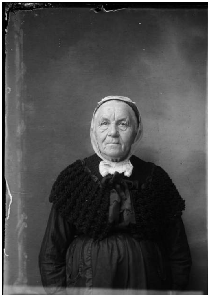
Portrait de femme âgée, négatif sur verre - Henri RAULT. Domaine public

Dans un jeu d'inversion de la vision, ces modèles photographiés semblent regarder le visiteur. Ils nous disent le temps qui passe et la vie qui défile sous le regard du photographe.