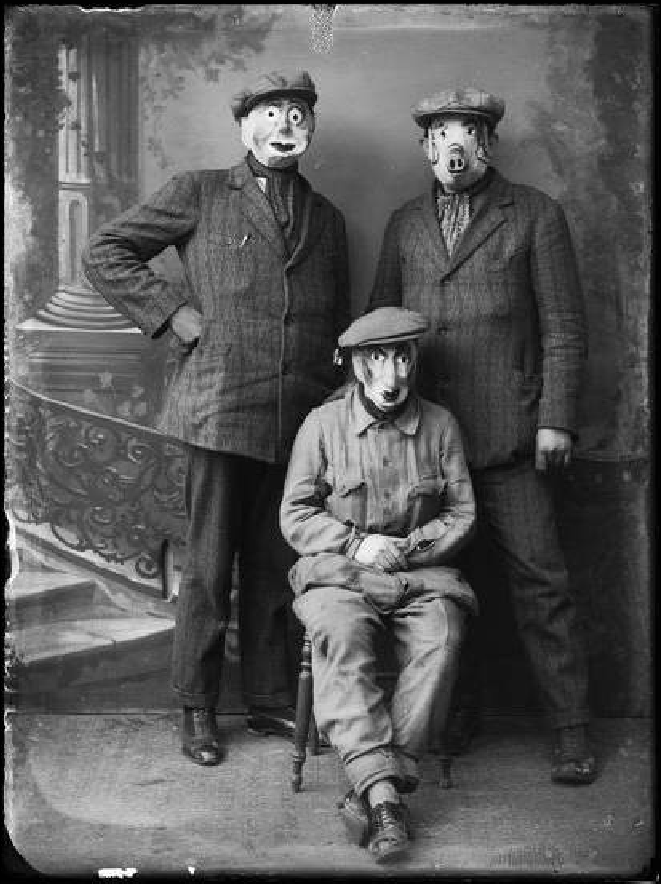
Portrait d'hommes masqués, négatif sur verre - Anne CATHERINE. CC-BY-NC-ND