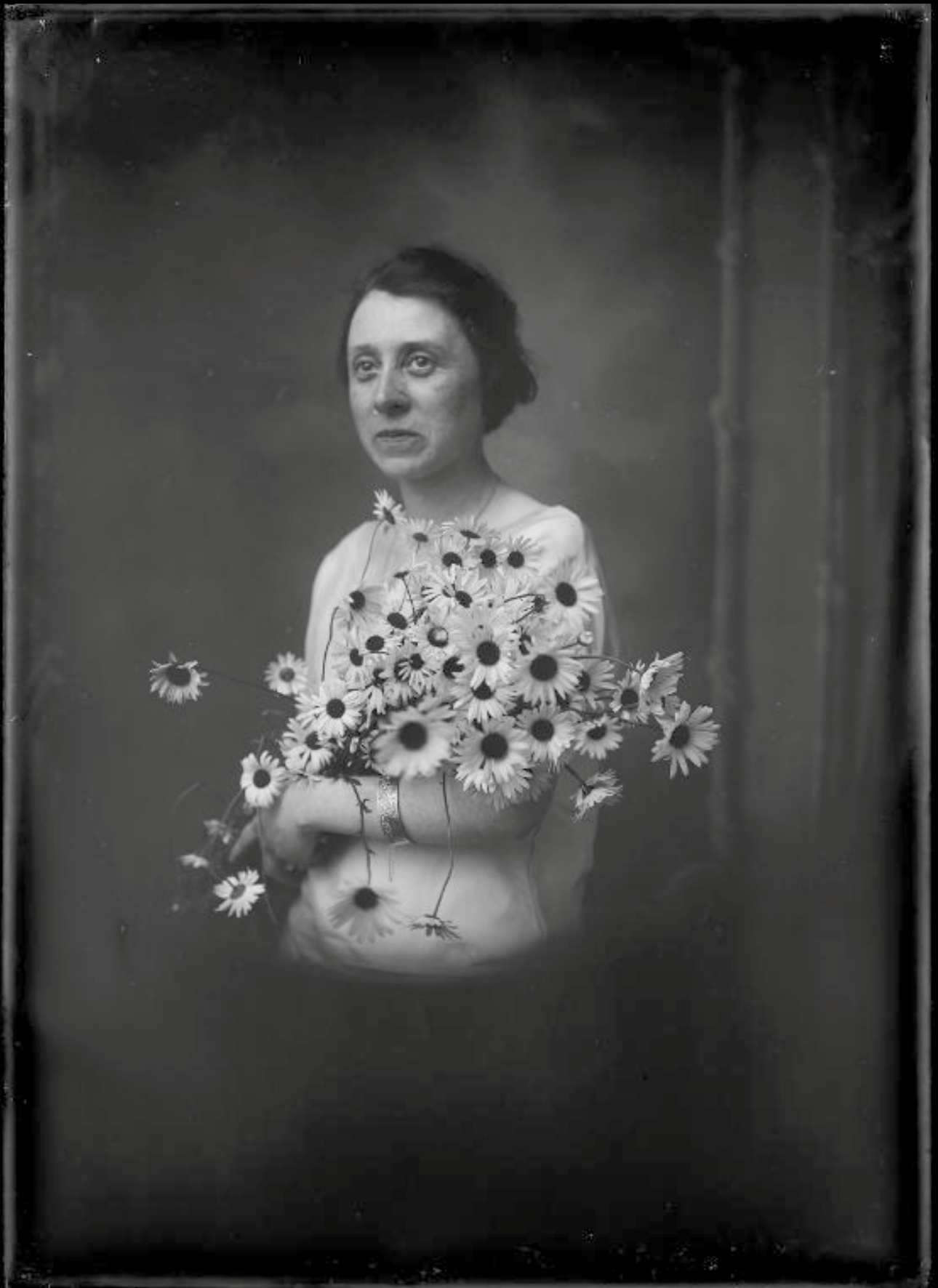
©Portrait de femme, négatif sur verre - Henri RAULT. Domaine public.