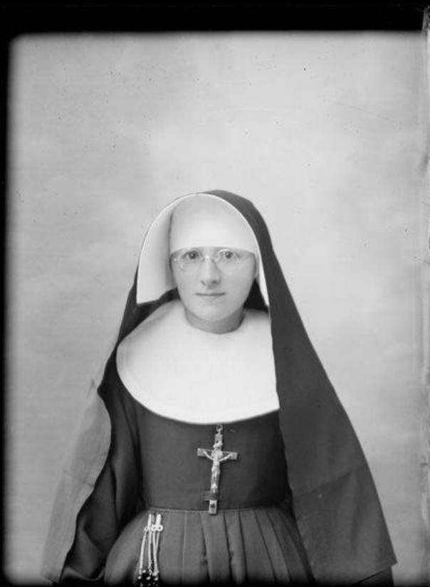
©Portrait de religieuse, négatif sur verre - Émile Jacques HOUDUS. CC-BY-SA