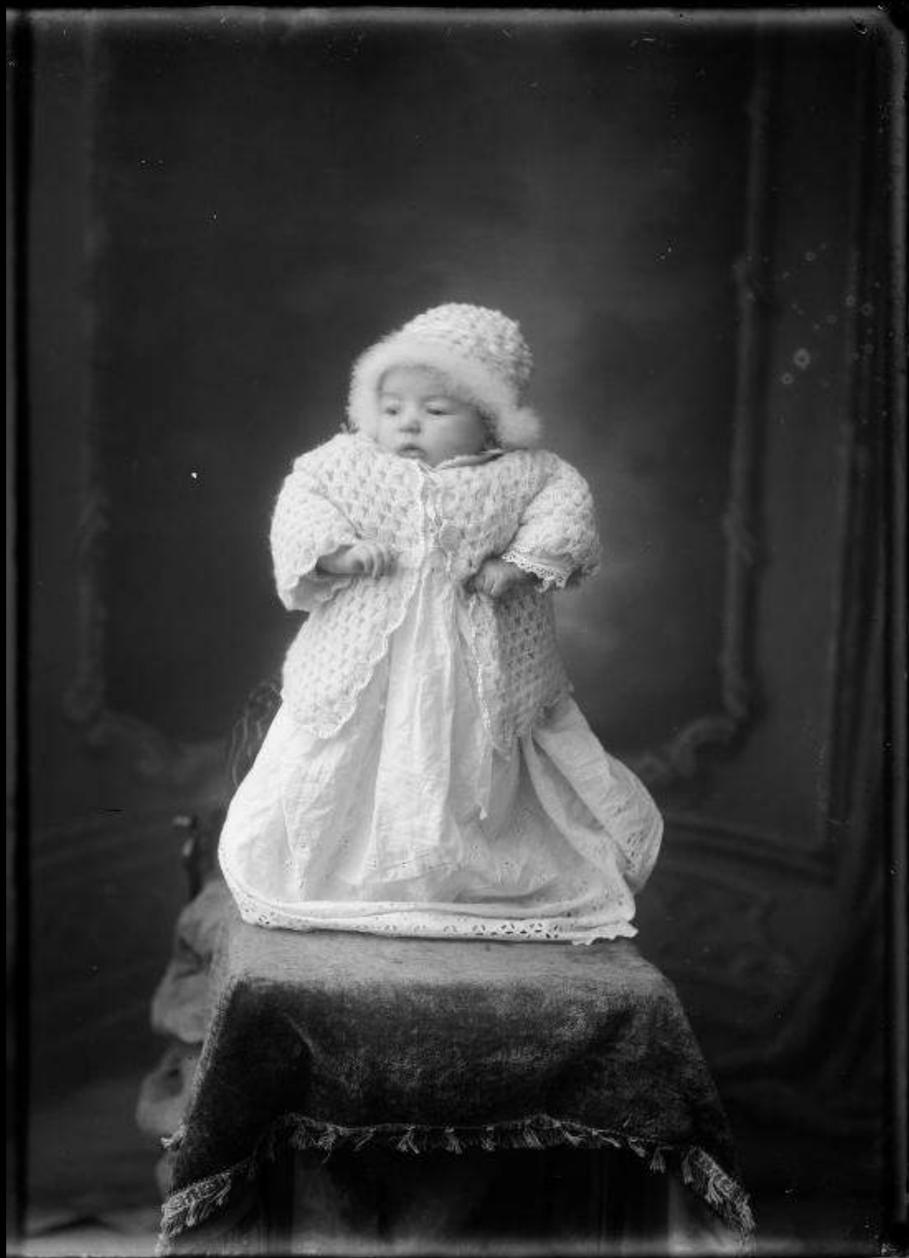
Portrait de bébé, négatif sur verre - Henri RAULT. Domaine public