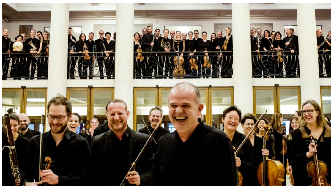
Orchestre Les Siècles

Ainsi, les artistes sont appelés à chanter dans les grandes productions lyriques de l'Opéra mais aussi en formation de chambre. Depuis 2004, le Chœur de l'Opéra de Lille se produit régulièrement dans différentes villes de la région et dans le cadre des Belles Sorties de la Métropole Européenne de Lille, en proposant des programmes lyriques ou de musique vocale de chambre réunissant des œuvres allant du XIX e au XXI e siècle.