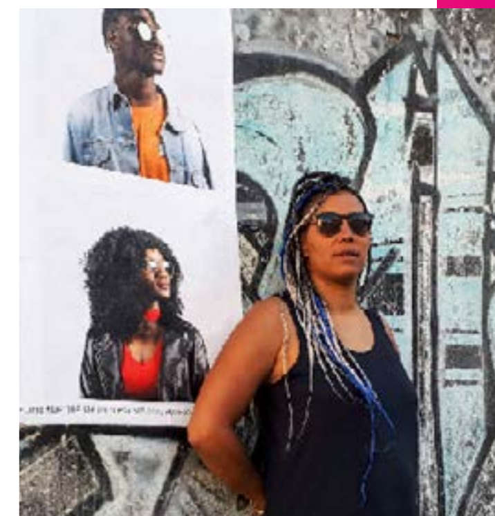
Colored Only © Helene Jayet - Signatures2018

Le travail d'Hélène Jayet, mêlant dessin et photographie, interroge l'histoire coloniale et la place arbitraire attribuée par les sociétés aux individus. Dans Colored Only , travail composé de plus de 160 portraits en studio, réalisés en grande partie en France, à Paris et Lille mais également à Amsterdam aux Pays-Bas, Hélène Jayet souhaite provoquer le débat de l'égalité pour tous en ne photographiant que des personnes noires. Cheveux relaxés, frisés, rasés, tissés, nattés, twist, Bantou knots , dreadlock ... Colored Only permet d'évoquer l'histoire, la mémoire, les questions identitaires mais aussi politiques car la coiffure est la traduction formelle de l'identité.