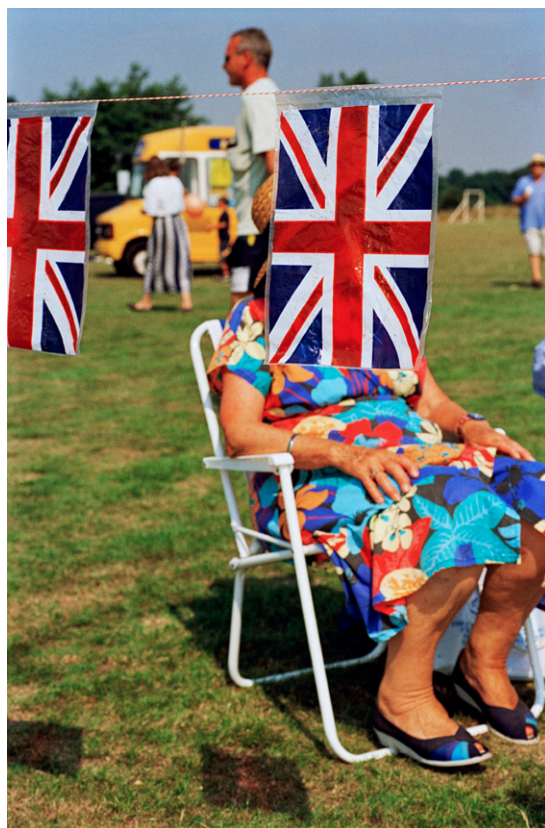
Sedlescombe, England, 1995-1999.