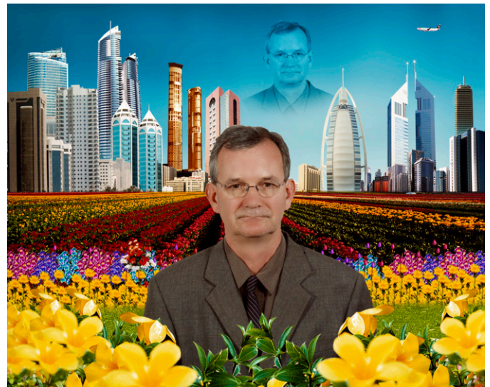
Autoportrait, Dubai, United Arab Emirates, 2007.

Le Frac Bretagne présente la première mondiale de la rétrospective Parrathon conçue par l'artiste et produite avec l'agence Magnum Photos en collaboration avec Fovearts. Celle-ci réunit ses obsessions, son goût du kitsch, son attirance pour la surabondance, son regard intuitif et critique sur notre société sans jugement de valeur, mais marqué de son goût très anglais pour le sous-entendu ironique.