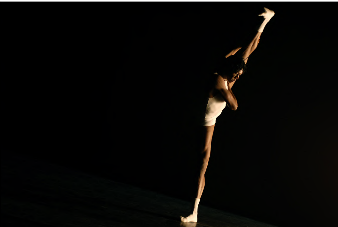
Lumière noire ENEMY IN THE FIGURE – Chorégraphe : William Forsythe – Ballet de l'Opéra de Lyon, Théâtre de la Ville, 2008