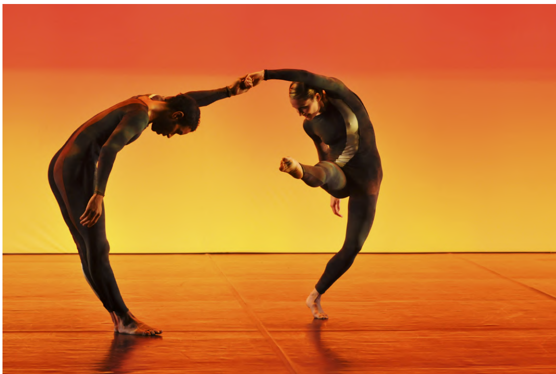
Ying et Yang NEARLY 90 - Chorégraphe : Merce Cunningham - Théâtre de la Ville, 2009