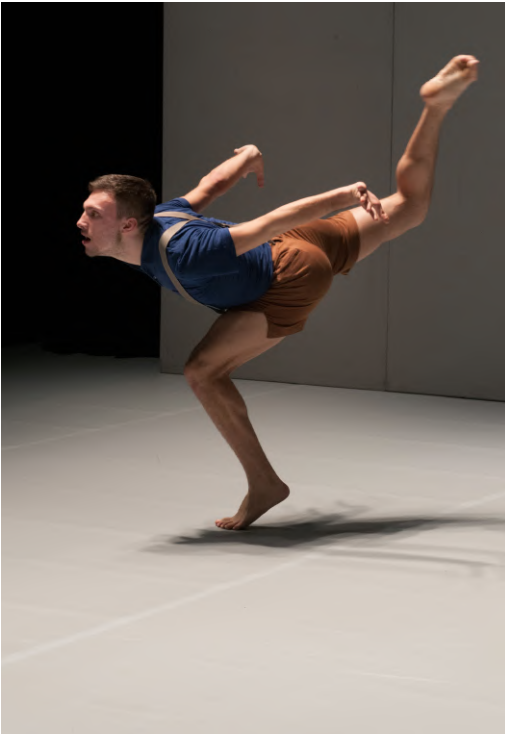
L'envolée MONO – Chorégraphie : Iramar Serussi - Centre National de la Danse de Pantin, 2013

Les photographies exposées sont présentées en plusieurs formats : 60x90cm et 80x120cm, contrecollées sur aluminium.