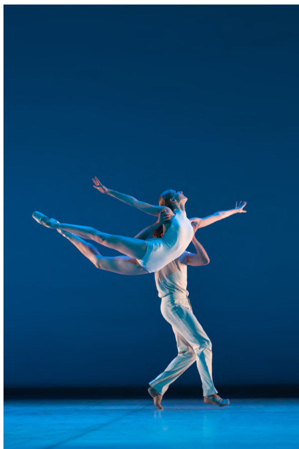
Freedom VERS UN PAYS SAGE - Chorégraphe : Jean-Christophe Maillot Théâtre du Châtelet, 2013