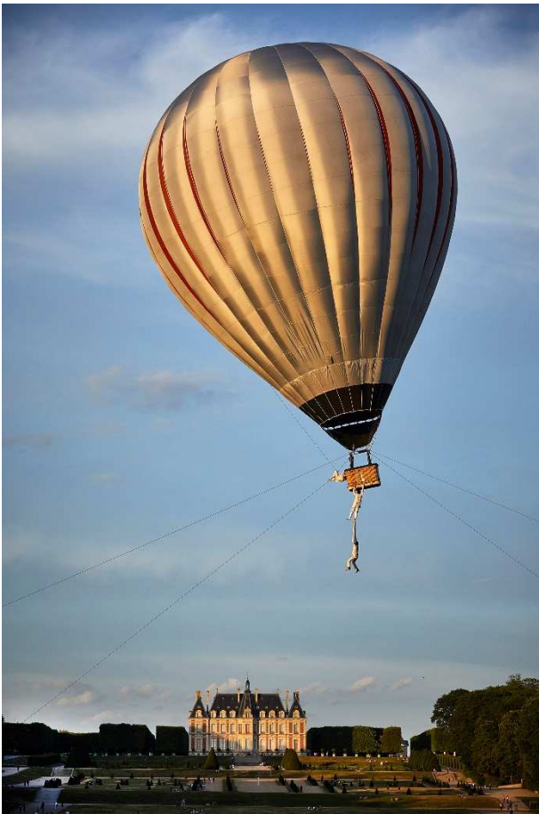
Cirque Inextremiste - Exit / Festival Solstice juin 2017

Christophe Raynaud de Lage photographie le cirque depuis vingt-cinq ans. Un quart de siècle de rencontres, de complicité avec des artistes, mais aussi d'instant volés et la possibilité d'être en situation privilégiée pour observer et rendre compte des mutations régulières d'un art en perpétuelle déconstruction.